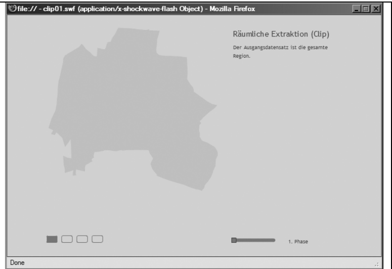
Abbildung 2: Graphik