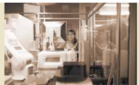
Antikörper: Mit spezieller Anlage schneller herzustellen.