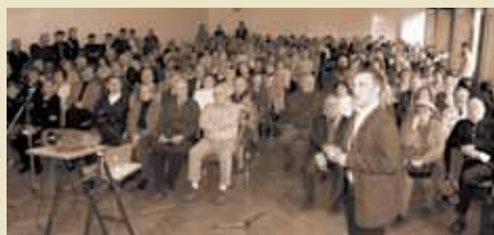
Sonntagsvorlesung: Forschung populärwissenschaftlich präsentiert.

2. März 2003 | Die Reihe der Sonntagsvorlesungen „Potsdamer Köpfe“ startet mit dem Thema „Gedächtnis und Lernen im Alter“.