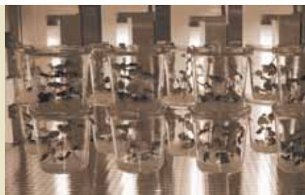
Im Visier der Forscher: Pflanzliches Wachstum.

11. Oktober 2006 | Das BIEM agiert nun im gesamten Land Brandenburg.