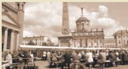
Uni-Sommerfest: Gelegenheit zum besseren Kennen lernen.

Oktober 1999 | Einweihung des Internationalen Begeg-