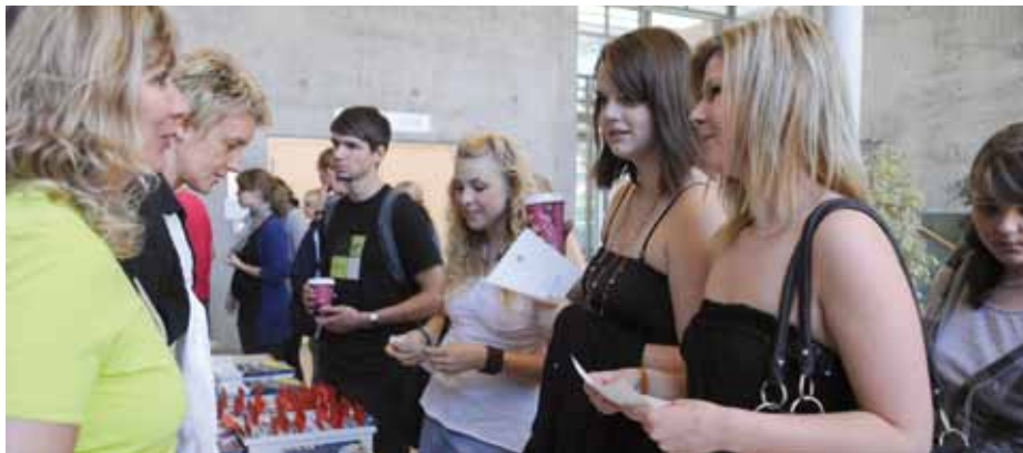
Von Anfang an im Programm: Der Hochschulinformationstag bietet seit 20 Jahren Orientierung bei der Studienwahl.

Aktiv für das Studienangebot der Universität zu werben, gehörte von Anfang an zu den Aufgaben der Studienberaterinnen. Schon im Gründungsjahr gab es einen Hochschulinformationstag. Zu den seit langem etablierten Informationswegen gehören auch Vortragsreihen und Informationsveranstaltungen in Schulen. In den letzten Jahren hat das Studierendenmarketing an Bedeutung gewonnen und neue Kommunikationswege wurden erschlossen. Mit dem seit 2008 laufenden hochschulübergreifenden Programm „Studium lohnt!“, dass die Uni Potsdam initiiert und leitet, sollen Brandenburger Schüler zum Studium motiviert werden. Seit November 2010 ist die Universität beispielsweise in den sozialen Netzwerken Facebook, und Studi-VZ und schon seit 2009 auf Schüler-VZ präsent. Das sind auch die Orte, an denen sich wichtige Teile der Werbekampagne „Studieren in Fernost“ der Hochschulinitiative Neue Bundesländer abspielen. Die Universität beteiligt sich an ihr und will so Studierende aus den alten Bundesländern gewinnen. ■