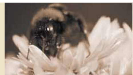
Wurden zum Gegenstand eines neuen Graduiertenkollegs: Insekten.

März 2002 | Die DFG-Forschergruppe „Bildung und Stabilität von beta-Faltblättern“ nimmt unter Federführung der Uni ihre Arbeit auf. Mehrere Berliner Einrichtungen sind beteiligt.