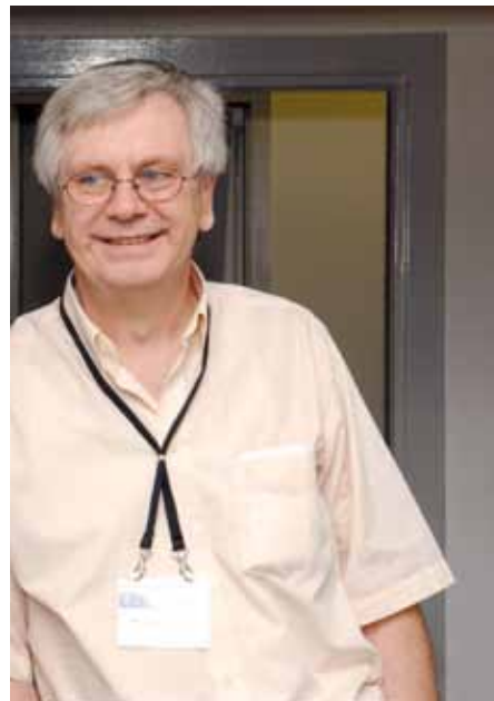
Fand in Potsdam Gleichgesinnte, die mit ihm gemeinsam die Grenzen der eigenen Disziplin überschritten: Leibniz-Preisträger Reinhold Kliegl.

se brachten dem 1994 gegründeten Interdisziplinären Zentrum für kognitive Studien weltweit höchste Anerkennung ein. Reinhold Kliegl wurde mit dem Leibniz-Preis ausgezeichnet und über-