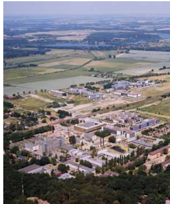
Aus der Vogelperspektive: Campus Golm und Wissenschaftspark in enger Nachbarschaft.