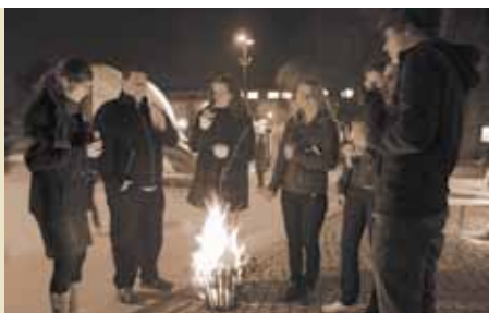
Erstsemesterbegrüßung: Lauschige Atmosphäre am Abend.