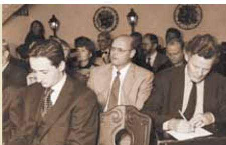
Bindeglied Unigesellschaft: Notieren, um zu vermitteln.