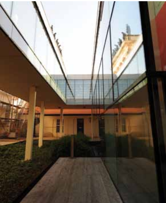
Campus Neues Palais: Altes spiegelt sich in Neuem.

Heizungssystem, bei dem jedem Umweltschützer die Haare zu Berge standen.