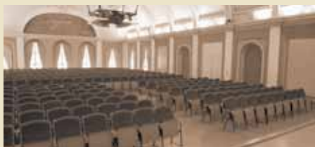
Auditorium maximumum: Nicht nur für die Lehre ein ganz besonderer Ort.

Frühjahr 1995 | Die Uni geht online. In Golm eröffnen drei Max-Planck-Institute.