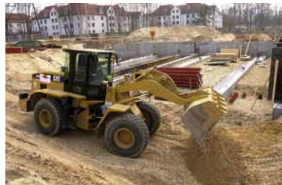
Buddeln für bessere Studienbedingungen in Griebnitzsee.