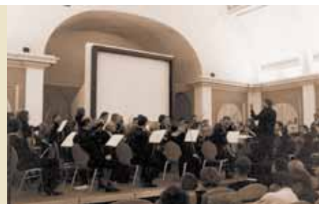
Den Proben folgten erste Auftritte.

7. Mai 1997 | Vorstellung einer Privatbibliothek mit etwa 2.000 Bänden in jiddischer Sprache. Der Stifterverband für die deutsche Wissenschaft finanzierte den Ankauf.