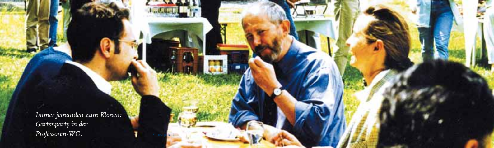
Immer jemanden zum Klönen: Gartenparty in der Professoren-WG.