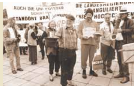
Ungewöhnliche Aktion: „Betteln“ vor dem Landtag.

November 1996 | Das brandenburgische Wissenschaftsministerium kürzt die Anzahl der zu finanzierenden Professuren auf 209.