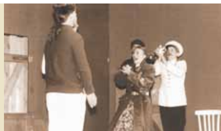
Unidram: Alles begann mit dem Stück „Jelisaweta Bam“ von Daniil Charms.

15. Juni 1994 | Die Wirtschafts- und Sozialwissenschaftli-