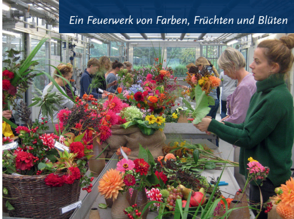
Ein Feuerwerk von Farben, Früchten und Blüten