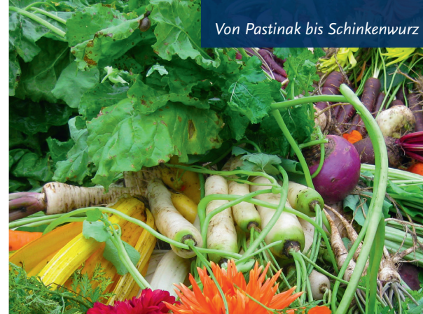
Von Pastinak bis Schinkenwurz