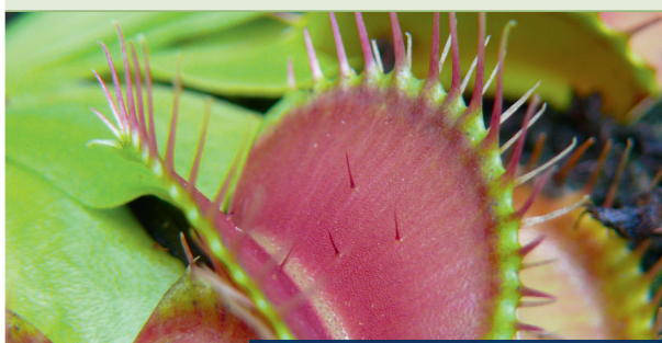
Aufgepasst – sonst schnappen sie zu!