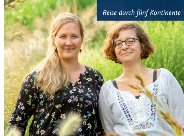
Reise durch fünf Kontinente