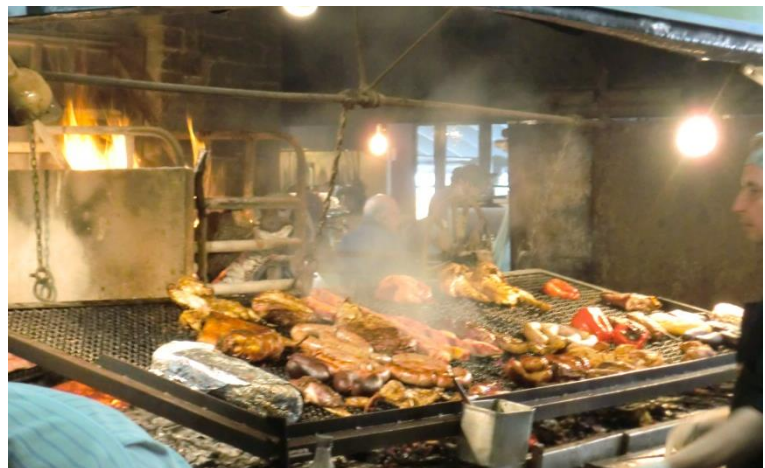
Abbildung 4: Ein klassisches Asado

Kulinarischen: Ein sehr einprägsames Bild ist ein Uruguayer mit seiner Mate. Sehr oft trägt der Uruguascho seine Mate in der Hand und gleichzeitig seine Thermoskanne mit heißem Wasser in dem gebeugten Ellenbogen. Kulinarisch dominiert