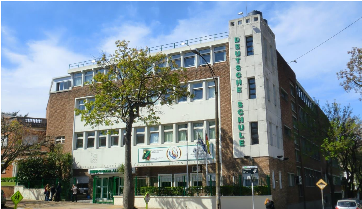
Abbildung 1: Deutsche Schule Montevideo - Sitz Pocitos