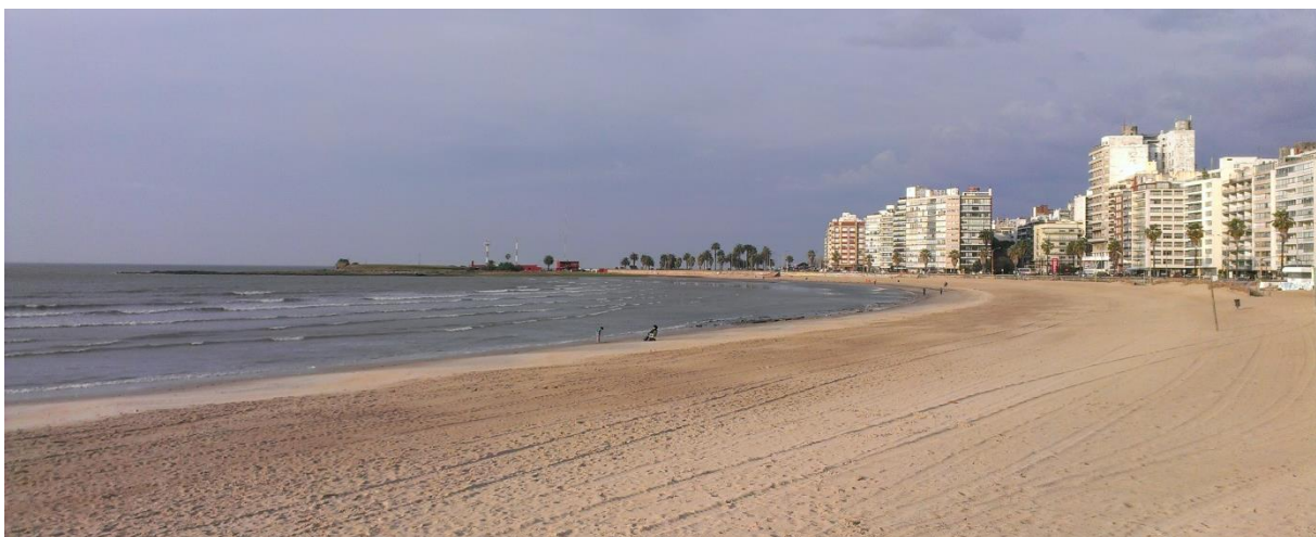
Abbildung 3: Der Strand im/ am Stadtteil Pocitos (eigene Aufnahme)

(Bus und Taxi). Das Busnetz ist Abbildung 2: Blick über Montevideo (eigene Aufnahme) gut ausgebaut und gut frequentiert. An den Haltestellen sind die Linien angeschrieben, aber es gibt keinen Zeitplan. Daher ist die App „Moovit“ sehr hilfreich. Eine normale Busfahrt kostet 26 Pesos (rund 90 Cent). Das Taxi ist ebenfalls relativ günstig, insbesondere natürlich, wenn man mit mehreren Leuten fährt. Die Stadt hat eine Vielzahl von Theatern. Als eine kleine Großstadt schätze ich das touristische Angebot aber auch nicht als überschwänglich umfangreich ein. Allerdings ist mein Eindruck auch dadurch bestimmt, dass ich von August bis Oktober in Montevideo gelebt habe. Die wohl lebendigere Zeit ist der Sommer von Dezember bis März. Am schönsten finde ich den Strand am Rio de la Plata, der sich am südlichen Rand der Stadt kilometerweit entlang zieht.