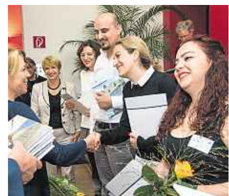
Geschafft. Die ersten Absolventen des Programms erhalten ihre Zertifikate.