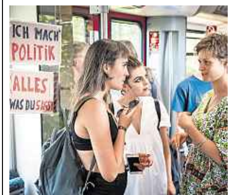
Ringrat. Politische Kommunikation im öffentlichen Raum.

Räte habe es in der Geschichte immer wieder gegeben, sagt der Student. Zum Beispiel in der Sowjetunion, deren Name sich vom russischen Wort für Rat ableitet. „Sowjet“ hießen zunächst die Arbeiter- und Soldatenräte, später aber auch die Führungsgremien der UdSSR. „Daher hat das Wort heute einen negativen Beigeschmack“, so Loewe. In der Berliner Ringbahn bringen die Studierenden die Reisenden nun wieder auf den Geschmack – mit Gesprächsstoff, aber auch mit Tee und Keksen. Die Kreidetafel informiert