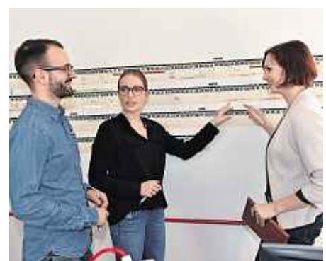
Kreativ. Die Gründer haben Ideen, wie man den richtigen Beruf findet.