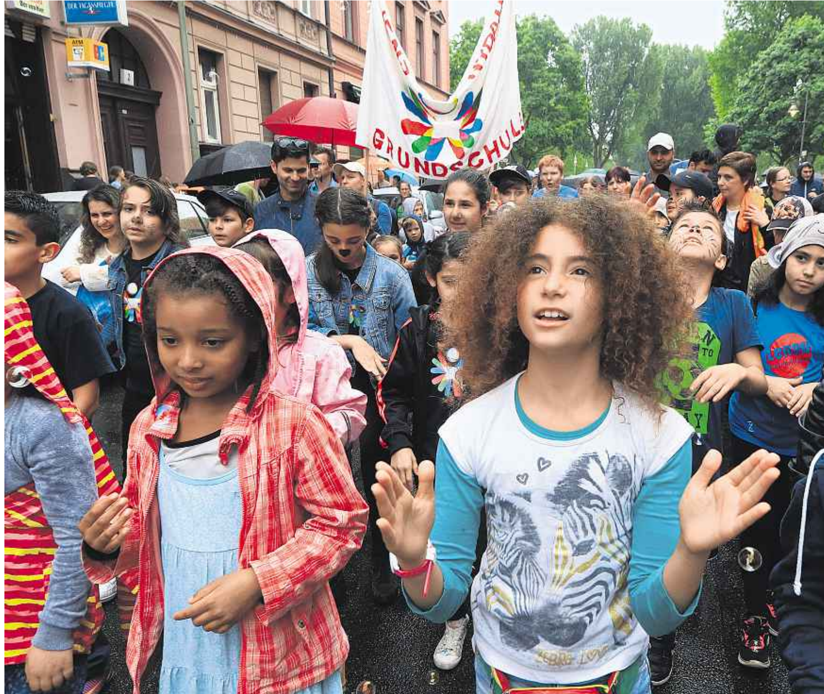
Babylonische Sprachvielfalt. Warum man sich in einer multiethnischen Gesellschaft trotz verschiedener Kulturen und Sprachen dennoch verstehen kann, gehört zu den Fragen der Potsdamer Sprachforscher.