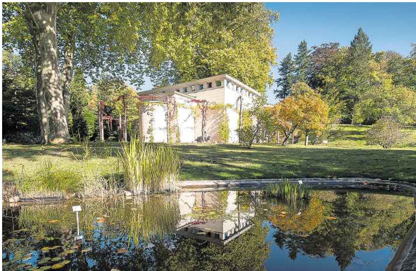
Grünes Labor. Im Botanischen Garten werden vom Aussterben bedrohte einheimische Wildpflanzen in Kultur erhalten, um sie später wieder auswildern zu können. Auch Kinder sollen in einem „Grünen Klassenzimmer“ die Artenvielfalt erkunden können.

Um Kinder frühzeitig für den Naturschutz zu sensibilisieren, richtete der Botanische Garten ein „Grünes Klassenzimmer“ ein. Die Schüler können hier selbst die Artenvielfalt auf der Wiese erkunden und Regenwürmer, Bienen und Spinnen entdecken. Die sinnliche Erfahrung, das