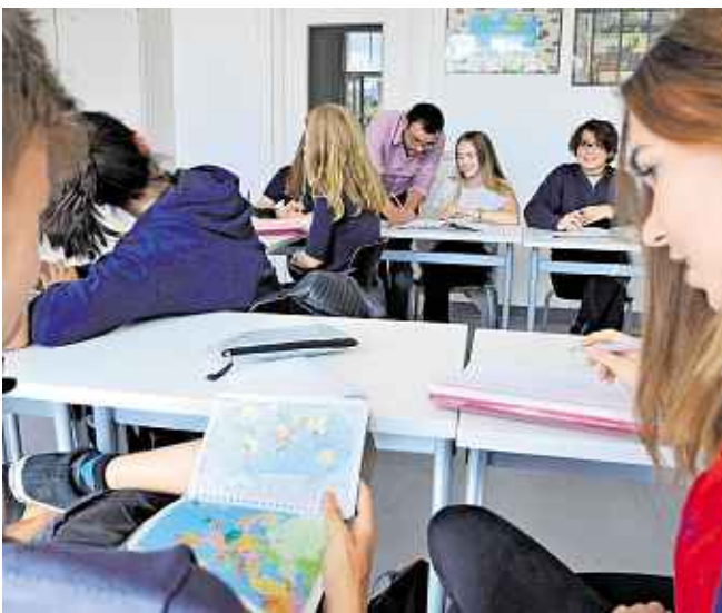
Die Motivation ist oft entscheidend, soll etwas Neues gelernt werden. Wie sich die Schüler im Unterricht besser motivieren lassen, erprobt ein Projekt im Netzwerk „Campusschulen“.