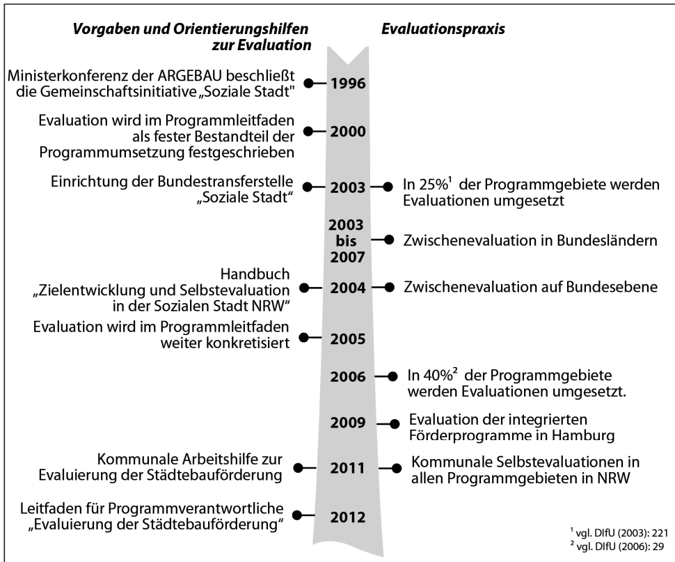
Abbildung 1: Evaluationsmeilensteine des Programms Soziale Stadt