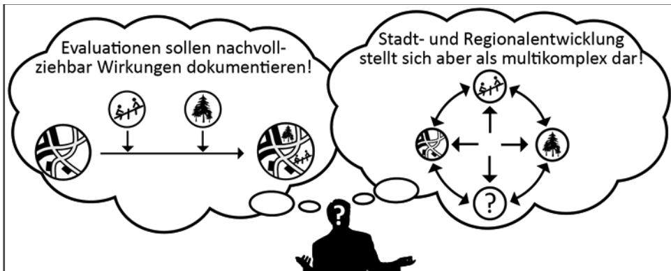
Abbildung 3: Komplexität als Evaluationsherausforderung