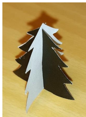
Abb. 2: fertiger Tannenbaum