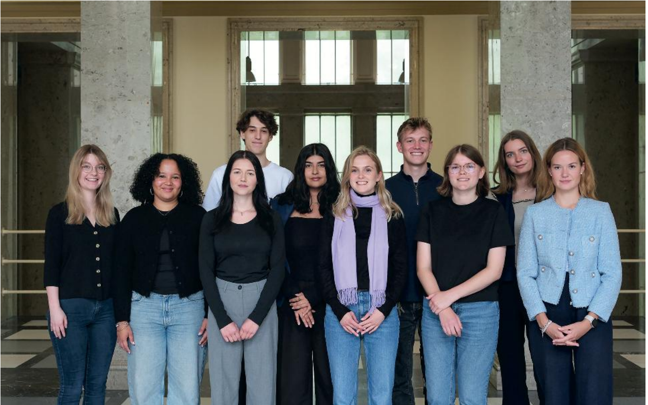
Gruppenbild von der *studere Redaktion in Haus 1 am Campus Griebnitzsee