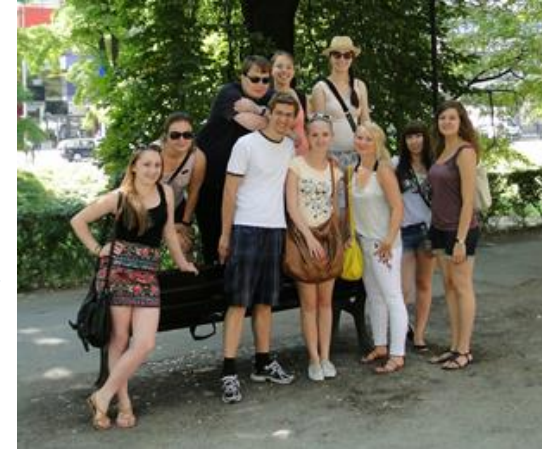
Tandemprojekt in Wrocław