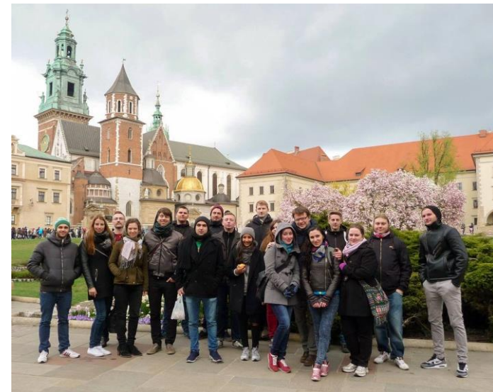
Exkursion nach Kraków