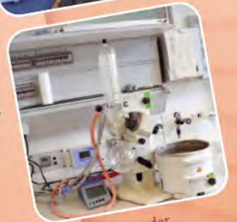
Laborversuche an der Universität Potsdam