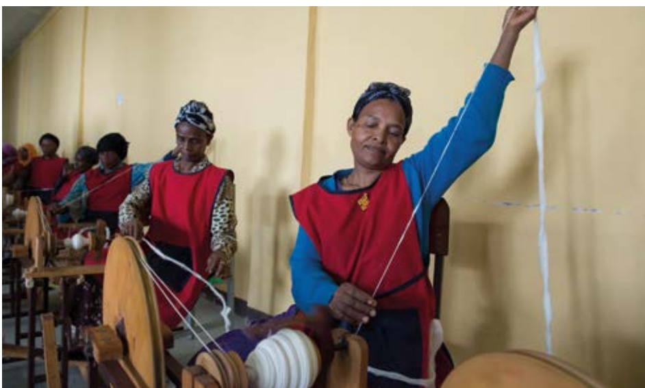
Auszubildende des Programms „Connecting 1,500 Women and Girls to the Export Market“ in Addis Ababa, Äthiopien, am Tag des Besuchs von UN-Generalsekretär Ban Ki-moon am 15. Juli 2015. Im Rahmen des Programms werden Frauen und Mädchen in handwerklichen Fertigkeiten ausgebildet wie Sattlerei, Weberei, Korbflechterei, Stickerei, Schmucksteinherstellung und Spinnerei.

Von Bedeutung ist auch die im Jahr 2000 von der Generalversammlung verabschiedete Millenniums-Erklärung. Die Erklärung zeigt, dass die Gleichstellung der