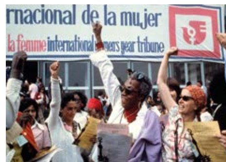
Die Erste Weltfrauenkonferenz der Vereinten Nationen wird am 19. Juni 1975 in Mexiko-Stadt eröffnet. 110 Delegationen sind bei der Eröffnungssitzung vertreten. Auf sechs weibliche Delegierte kam ein männlicher Delegierter. Flo Kennedy (Mitte) aus den USA demonstrierte mit anderen Frauen vor der Tribüne, dem Ort der parallel stattfindenden Nichtregierungskonferenz. Die beiden Konferenzen fanden vom 19. Juni bis 21. Juli in unterschiedlichen Bezirken statt.

Die Zweite Weltfrauenkonferenz zur Halbzeit der Dekade 1980 in Kopenhagen war stark von Nord-Süd-Gegensätzen geprägt, betonte jedoch die drei wesentlichen (Entwicklungs-)Bereiche der Dekade: Arbeit, Gesundheit und Bildung. In diese Zeit fällt auch die Gründung wichtiger Institutionen. Aus einem freiwilligen Fonds der Dekade, der 1976 eingerichtet wurde, ging 1985 der Entwicklungsfonds der Vereinten Nationen für die Frau (UN Development Fund for Women – UNIFEM) hervor. UNIFEM initiierte und unterstützte Maßnahmen zur Frauenförderung in den