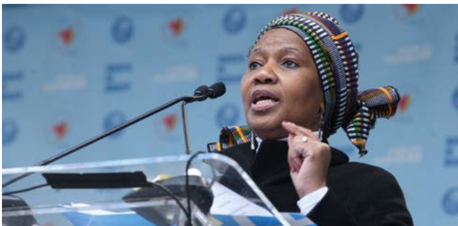
Phumzile Mlambo-Ngcuka, Exekutivdirektorin von UN Women hält eine Ansprache vor Beginn des Marsches für Geschlechtergleichheit und Frauenrechte am Internationalen Tag der Frau in New York City, 8. März 2015.

und mangelnde Ressourcen geschaffen. Doch auch die neue Organisation leidet unter einer Unterfinanzierung. Praktisch die gesamten Mittel für die operative Arbeit, etwa 98 Prozent des Gesamthaushalts, stammen aus freiwilligen Zuwendungen. Das bisherige Budget der vier Vorgängerorganisationen sollte daher deutlich erhöht werden, um langfristig einen Jahreshaushalt von 300 Millionen US-Dollar zu erreichen. Nach anfänglichen Schwierigkeiten konnte UN Women dieses Ziel 2013 mit 275,4 Mio. US-Dollar fast erreichen.