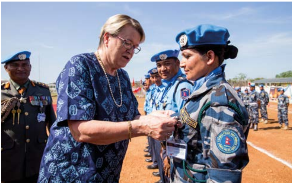
Die aus Nepal stammende geschlossene Polizeieinheit und das Polizeikontingent der UN-Mission in Südsudan (UNMISS) wird am 2. September in Juba, Südsudan, ausgezeichnet. Im Bild steckt Ellen Margrethe Løj (Mitte links), Leiterin der UNMISS, einer Angehörigen der Mission eine Medaille an.

Die Resolution 1325 und ihre Folge-resolutionen 1820 (2008), 1888 (2009),