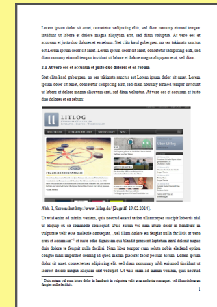
Abbildung im Fließtext