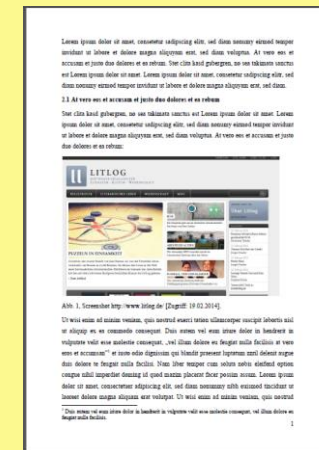
Abbildung im Fließtext