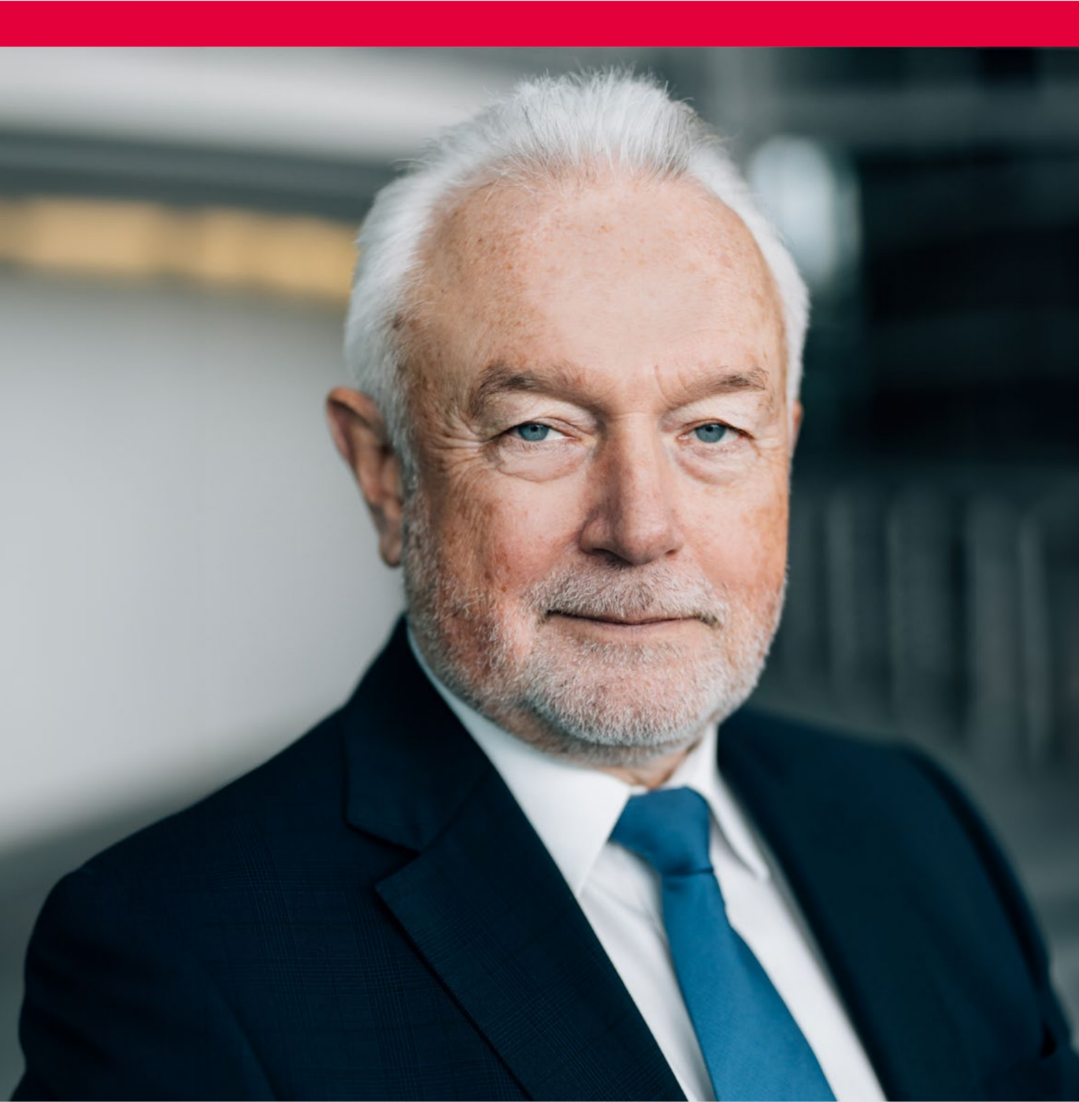
© Wolfgang Kubicki / Foto: Tobias Koch