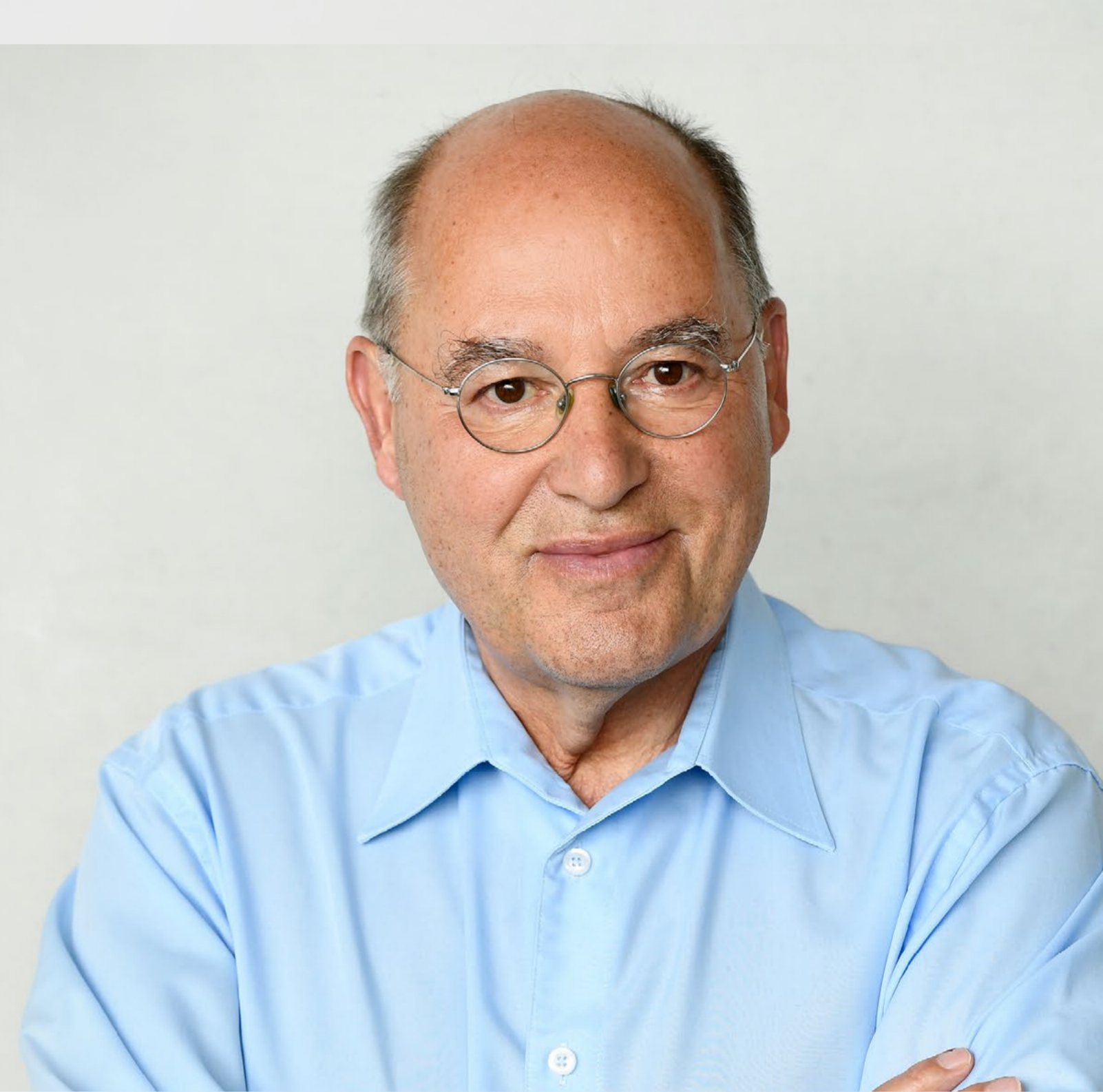
© Dr. Gregor Gysi / Foto: Deutscher Bundestag/Inga Haar

JURISTISCHER SALON Liberale Hochschulgruppe Potsdam (LHG)