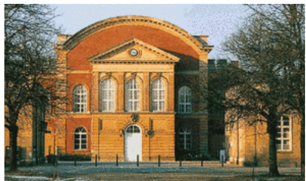
Universität Potsdam: Am Neuen Palais 10, Haus 8, Auditorium maximum Tagungsort der ZKI-Frühjahrstagung 2010